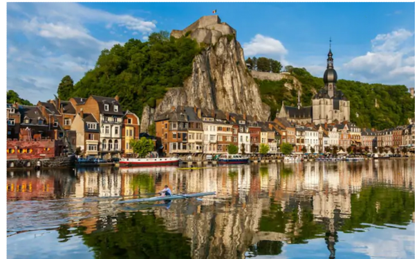
A 20 km de part et d'autre du chalet, les très jolies villes de Namur & Dinant. Citadelles, églises, musées, restaurants, shopping, évènements,...